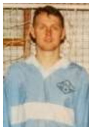
Олег Пушкин «Дебют»